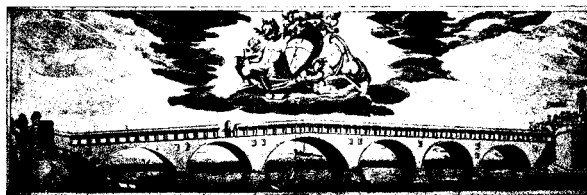
Il Ponte nel secolo XVII - disegno di A.Massara; incisione di I. Collo; edizione di O. Ballada

Il ponte coperto di Pavia sul Ticino, che resistette fino al 1944 alle ingiurie del tempo e degli uomini, era famoso, fuori della cerchia cittadina, perchè elemento pittoresco e caratteristico del paesaggio e della città medioevale, e per essere uno tra i rari monumenti trecenteschi di tale genere ancora esistenti.