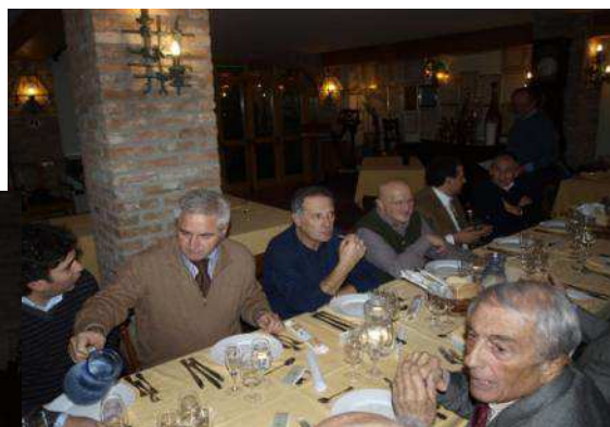
Momenti di convivialità prima dell'impegno elettorale