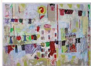
Casa, 2006, tecnica mista su tela, cm 80x120

RIVANAZZANO TERME - VIA INDIPENDENZA, 18 TEL. 0383.93229 CELL. 348.2526049